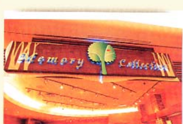
▲精品廊專賣相簿，他設計的招牌，是樹上掛一片紅葉，取一葉知秋之意，落葉能勾起我們的回憶，相當貼題。

被禁。其後，他還監製過伊雷主演的《鯊魚燒賣》、于洋主演的《花劫》。馮永發的告別作，是徐小明執導、講風水的《風水水起》。徐小明記得：「《風》片當年十大賣座片，票房勁收四百萬，馮永發開心到請我們吃了四次慶功宴。」