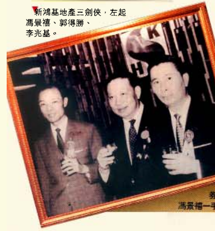
新鴻基地產三劍俠，左起馮景禧、郭得勝、李兆基。

馮永發還時刻拿著一支Samsung錄音筆自言自語，為他的整蠱偷拍節目度橋。他舉例說，有士多老闆，在店內放了一副棺材，對顧客說：「這裏剛剛死了人，他身上的飾物，你自己除出來啦，一折賣給你！」然後有人拿著Cameo從棺材跳出來，「哈哈，玩吓啫！」他愈說愈興奮。