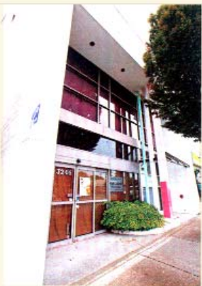
▲他的首次創業，是在這裏開雜貨店和影樓，現在成為了他私人辦公室。